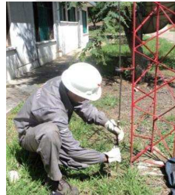
Formación en uso correcto de EPP (izquierda). Verificación anual puestas a tierra de pararrayos de instalaciones y polvorines (derecha).