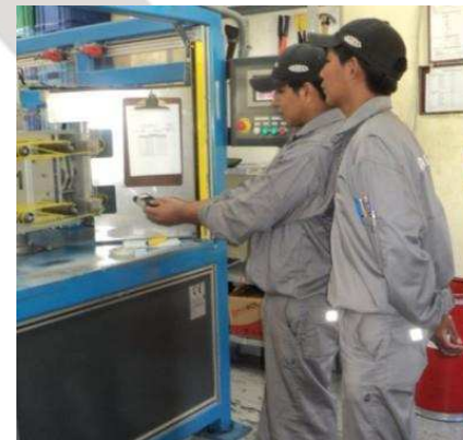
Personal operativo y técnico participa en los comités de seguridad. (izquierda). Estudio de niveles del ruido en puestos de trabajo (derecha).