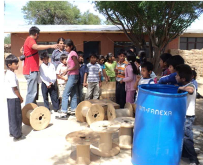
Trabajos manuales y entrega de materiales varios a escuelas de Santivañez.