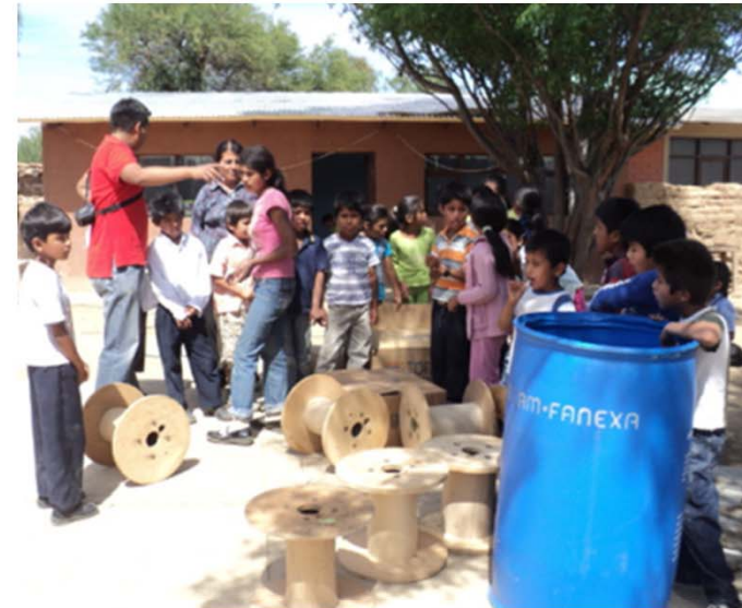
Trabajos manuales y entrega de materiales varios a escuelas de Santivañez.