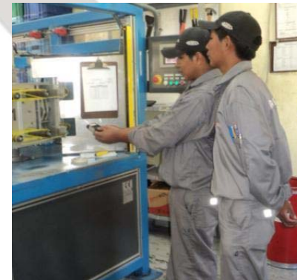
Personal operativo y técnico participa en los comités de seguridad. (izquierda). Estudio de niveles del ruido en puestos de trabajo (derecha).