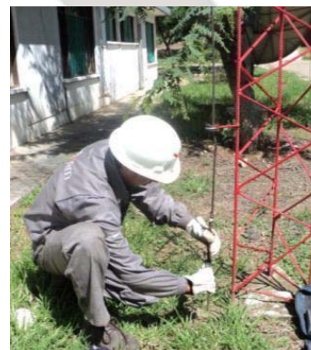
Formación en uso correcto de EPP (izquierda). Verificación anual puestas a tierra de pararrayos de instalaciones y polvorines (derecha).