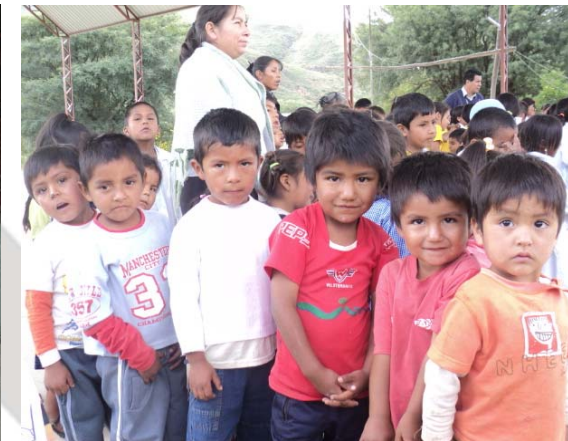
Festejo realizado en la Unidad Educativa Falsuri en la localidad de Atocha (izquierda). Donación material deportivo el día del Niño en la localidad de Santivañez (derecha)